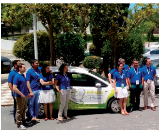
Parte del equipo de I+D de Aqualia, con el VW eco UP! Presentado.